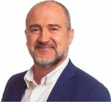
Alfredo Clúa Alcalde de Cambrils